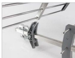
Système CLIC CLAC Montage facile